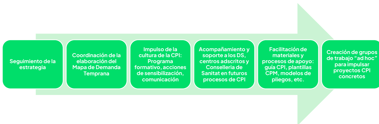
Ilustración 1 Funciones Oficina Técnica CPI en Fisabio