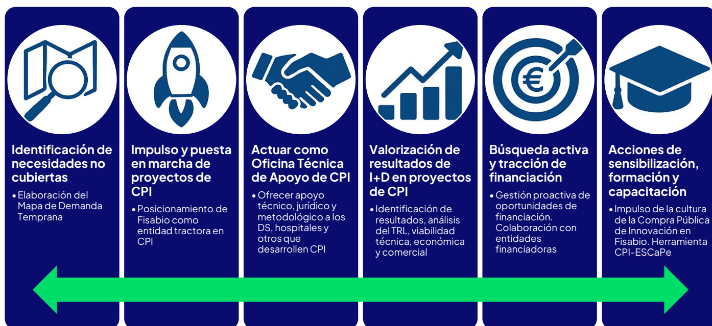
Ilustración 2 Ejes principales de la estrategia de Compra Pública de Innovación

Esta Oficina articulará su plan de acción en torno a 6 ejes principales , sirviendo como órgano de gobierno central e impulsor de las actividades, ya sea como responsable principal o como unidad de apoyo: