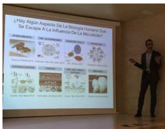
Microorganismes d'interès per a la salut en el 6é Ateneu Biomèdic de la Càtedra Fisabio – UV

El 5 de novembre es va renovar el conveni de col·laboració entre l'Ajuntament d'Alzira i FISABIO per a dur a terme el projecte RIU. Un projecte que des dels seus inicis, en 2011, ha treballat per millorar l'accés als serveis i programes de salut al barri de l'Alquerieta.