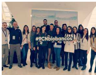
Rècord de participació i premis de la Xarxa Valenciana de Biobancs en el IX Congrés Nacional d'Oviedo