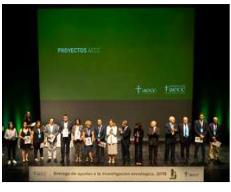
Dos projectes d'investigació del càncer amb participació d'investigadors/es de Fisabio reben finançament de l'AECG

La conferència i el col·loqui del 6é Ateneu Biomèdic va oferir a una audiència d'unes 70 persones una introducció detallada al món i l'estudi dels microorganismes, especialment la seua evolució i impacte en la salut humana en la sala d'actes de Fisabio – Salut Pública.