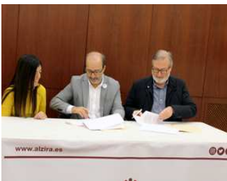
Fisabio i l'Ajuntament d'Alzira renoven el conveni de col·laboració per a Projecte RIU