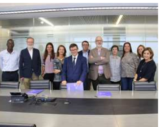
La Fundació FISABIO, INCLIVA i IIS LA FE harmonitzen les seues condicions de licitació